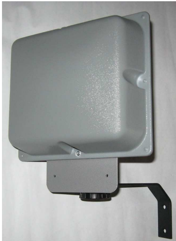
Рис.1 АКМ-900(Н), вид с переди.

Разработка была проведена с целью снижения стоимости АКМ-900(Н) (отказ от применения дорогостоящих импортных компонентов), при условии сохранения и улучшения технических характеристик, предыдущих моделей.